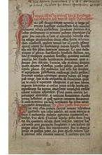
Pierwsza strona księgi (XIII wiek)